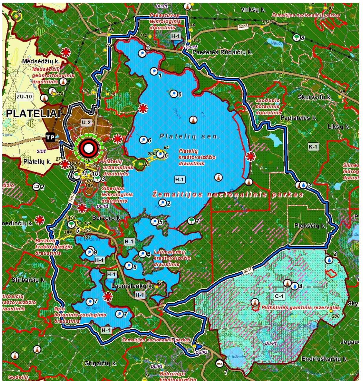
2 pav. Iškarpą iš Plungės rajono savivaldybės teritorijos bendrojo plano keitimo Pagrindinio brėžinio